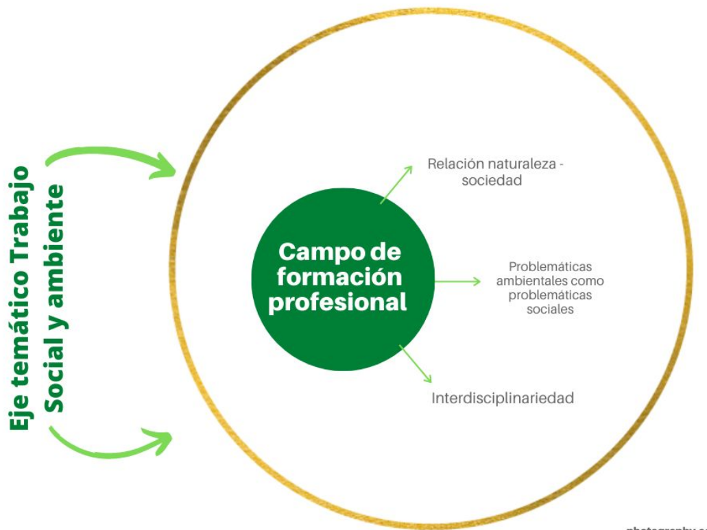
Ilustración 2. Propuesta eje temático ambiental.

Se reitera que esta propuesta no se reduce únicamente a una clase tipo seminario donde se discuta la cuestión social, pues iría en contravía de la definición de Educación Ambiental como proceso reflexivo; se propende por una transversalización de la cuestión ambiental no como un área o campo de acción del Trabajo Social, sino como un compromiso ético y ciudadano al involucrar aspectos que hacen parte del quehacer profesional pero también del diario vivir.