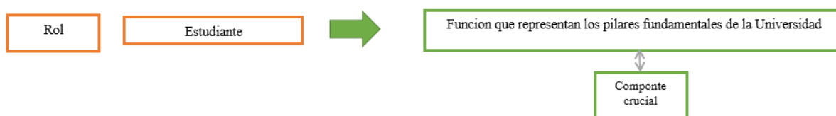
Figura 2. Taxonomía categoría Inductiva N°2: Funcion que representan los pilares fundamentales de la universidad

Según, Hopenhayn, M. y Sojo, A. (2011) sostienen que el sentido de pertenencia se relaciona con los lazos afectivos, las emociones, la memoria y la identificación de las personas con el grupo y con el ambiente donde se desenvuelven y, por consiguiente, con la construcción de la propia identidad, ya que ésta implica la pertenencia a un grupo social y a un territorio específico.