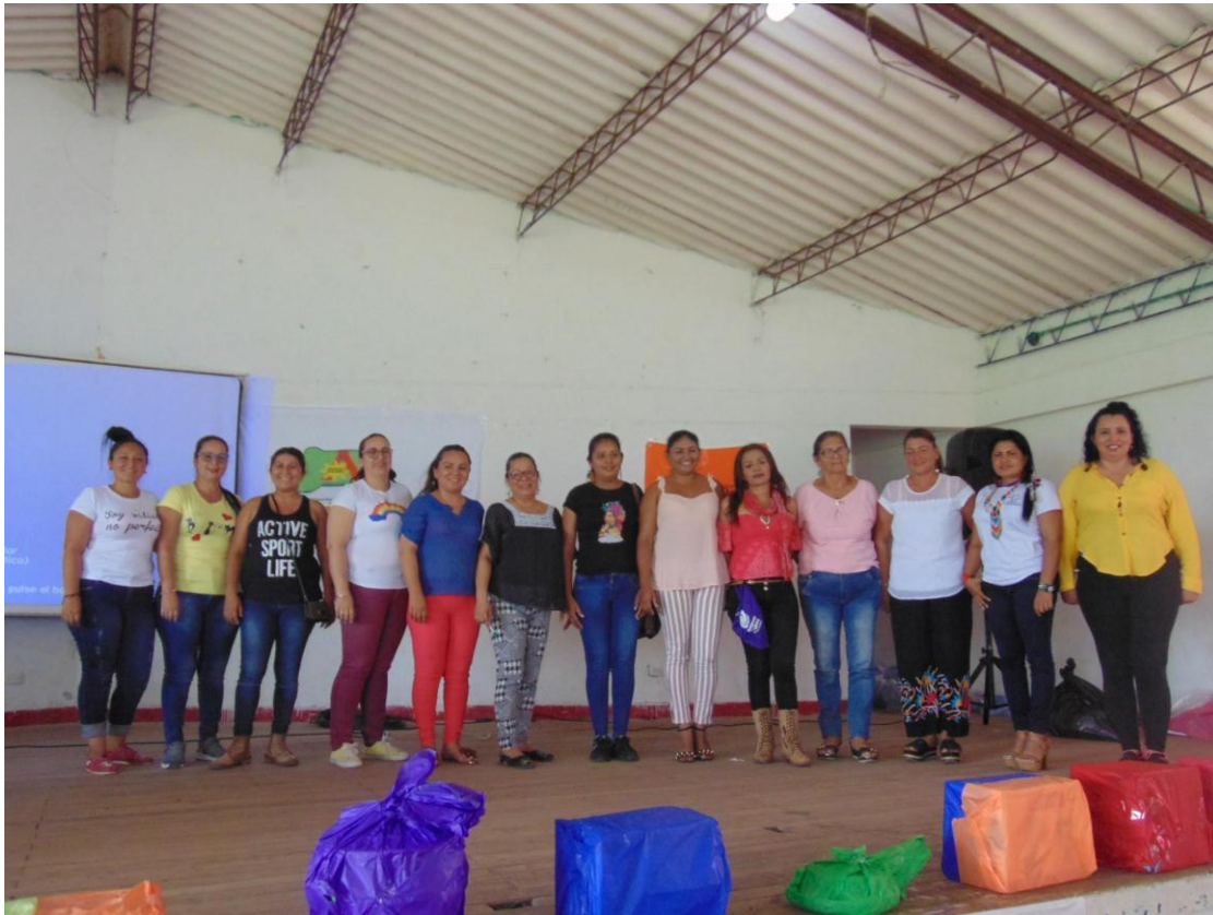
Foto 1. Junta directiva departamental de la AMAR. Fotografía tomada en Asamblea Informativa, Arauca 2019.

entienden como grupos de trabajo presentes en distintos sectores de los municipios. Las mujeres adelantan sus acciones a partir de sus ejes de trabajo: formación y organización; salud, ambiente y territorio; gestión y producción; derechos humanos y derechos de las mujeres; cultura, recreación y deporte, y comunicación alternativa.