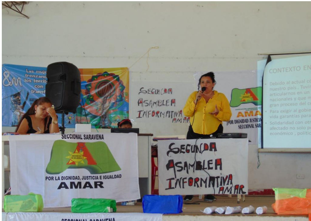
Foto 3. Fotografía tomada en Asamblea Informativa, Arauca 2019