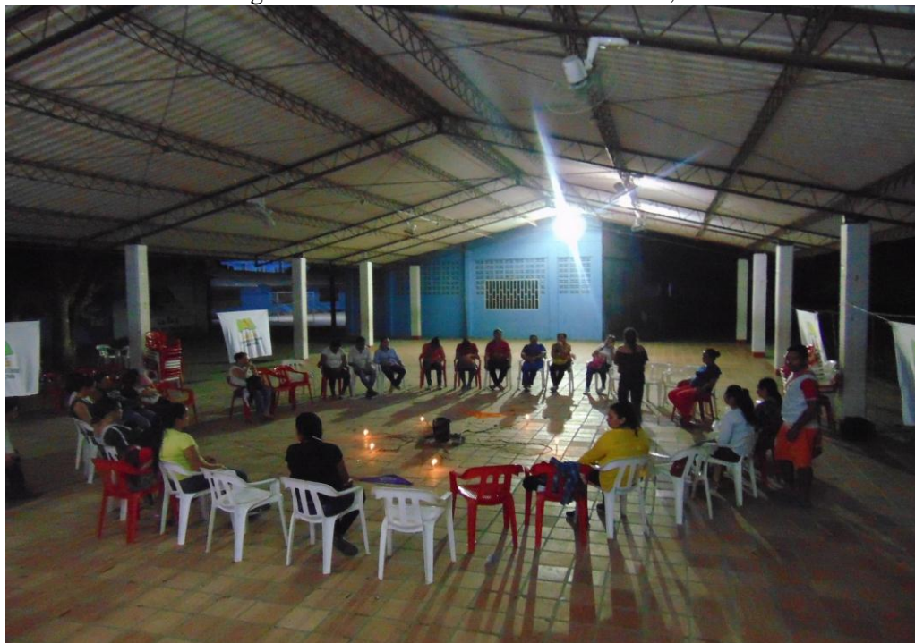
Foto 4. Fotografía tomada en Asamblea Informativa, Arauca 2019