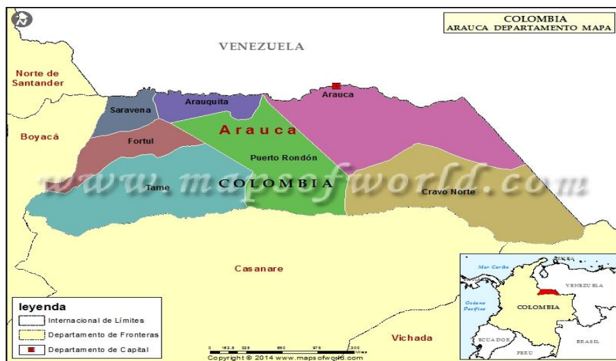
Gráfica 2. Mapa de Arauca Colombia. Retomado de mapas del mundo (2014) https://espanol.mapsofworld.com/continentes/mapa-de-sur-america/colombia/arauca.html

y movilización social, este movimiento articula procesos como; El Movimiento Campesino-Cooperativo, la Asociación de Educadores de Arauca (ASEDAR), la Asociación de Jóvenes y Estudiantes (ASOJER), La asociación de derechos humanos JOEL SIERRA, las juntas de acción comunal (ASOJUNTAS), la Cooperativa Agropecuaria del Sarare (COAGROSARARE), la Cooperativa de transporte del Sarare (COOTRANSARARE) la Asociación Nacional Campesina José Antonio Galán Zorro (ASONALCA) y la Asociación de Mujeres Amanecer por Arauca ( AMAR), y cuenta con propuestas de economía solidaria y de comunicación alternativa como; la empresa comunitaria de Acueducto, Alcantarillado y Aseo de Saravena (ECAAAS), la emisora Comunitaria “Sarare FM STEREO”, y el periódico “Trochando Sin Fronteras”.