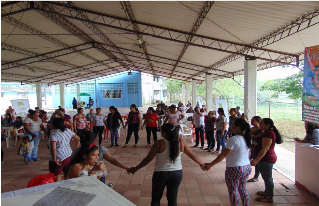
Foto 7. Fotografía tomada en Asamblea Informativa, Arauca 2019.

su mayoría estaban desde los inicios de la AMAR para que nos brindaran mayor información sobre la organización y las acciones que realizan.