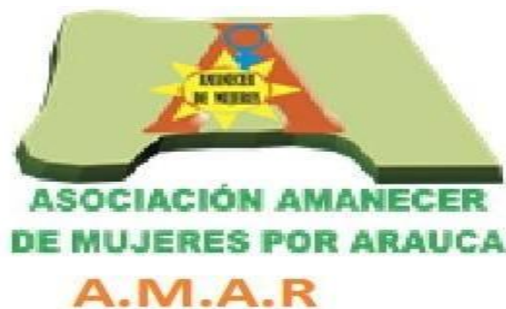
Imagen 1. Tomada de Asociación Amanecer de Mujeres por Arauca, retomado de: https://www.facebook.com/profile.php?id=100010467966789&fref=ts

La Asociación Amanecer de Mujeres por Arauca (AMAR), es una organización social de mujeres, legalmente constituida y sin ánimo de lucro, que se extiende a lo largo y ancho de Arauca. En municipios como; Tame, Arauquita, Fortul, Saravena, Cravo Norte, Puerto Rondón y Arauca capital, es donde se tienen incidencia con trabajo territorial. En el año 2003, empieza el encuentro sobreponiéndose fehacientemente a las circunstancias que el contexto histórico, económico y político de la época. Con el objetivo de juntar fuerzas, reconocer capacidades y resistir, las mujeres de Arauca se organizan, luchan y proclaman banderas reivindicativas que atraviesan sus condiciones sociales, económicas, y políticas, pero, sobre todo, su compromiso para con sus afiliaciones éticas y políticas.