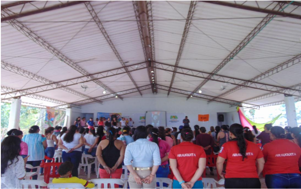
Foto 5. Fotografía tomada en Asamblea Informativa, Arauca 2019