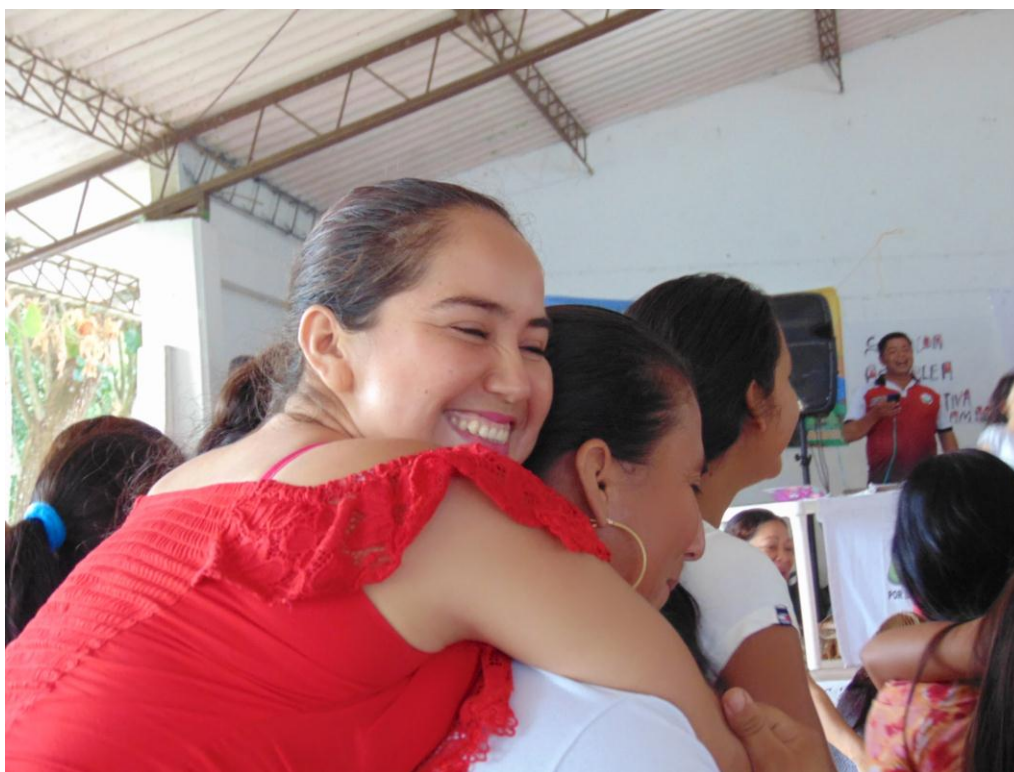
Foto 6. Fotografía tomada en Asamblea Informativa, Arauca 2019.

Comprendiendo que la recolección de las voces que atraviesan el conflicto, son las únicas capaces de hacer dilucidar aspectos que históricamente han sido invisibilizados, esta investigación retoma las narrativas de las mujeres líderes en Arauca y todas las acciones que han realizado para hacerle frente a las circunstancias que limitan su realización y su comprensión de la realidad.