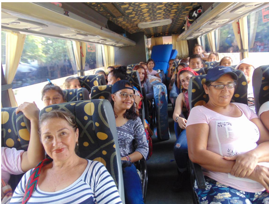
Foto 8. Fotografía tomada en Asamblea Informativa, Arauca 2019.