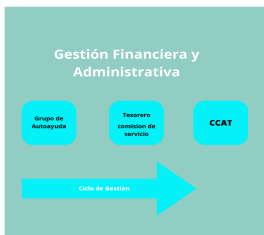
Figura Gestión financiera

El proceso de gestión administrativa comprende un comité de 5 miembros en promedio los cuales designan a uno de ellos como el tesorero este tesorero también asume funciones administrativas para la toma de decisiones y de gestión de los recursos, en caso de que el grupo tenga inconvenientes financieros, existe un comité de CCAT (Centro de alcohólicos y toxicómanos) quienes son los encargados de gestionar ayudas y de igual manera también tienen dentro de sus funciones la gestión de la literatura, con esta estructura se gestionan recursos con el propósito de que los grupos se mantengan y puedan prosperar.