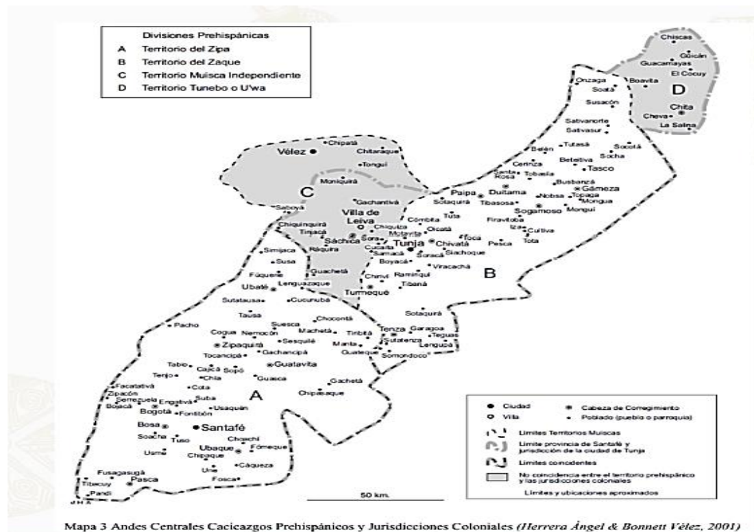
Ilustración 1 Mapa donde se identifica el territorio Muisca, https://cabildomuiscabosa.org/que-es-el-cimb/

De igual manera, Gamboa (2008) expone que según estudios arqueológicos de Gerardo Ardila y Gonzalo Correal, se estipula que entre los años 8500 y 3000 antes del 2008, se desarrolló la agricultura y la domesticación.