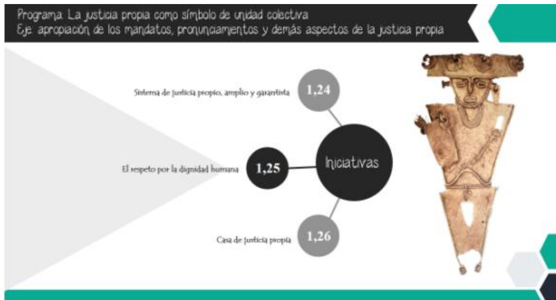
Ilustración 5 Programa la justicia propia como símbolo de unidad colectiva eje, apropiación de los mandatos, pronunciamientos, y demás aspectos de justicia propia / Plan de vida Cabildo Muisca de Bosa.

El cual él 1, 24 indica un sistema de justicia propio, amplio y garantista, que es la proyección del mismo.