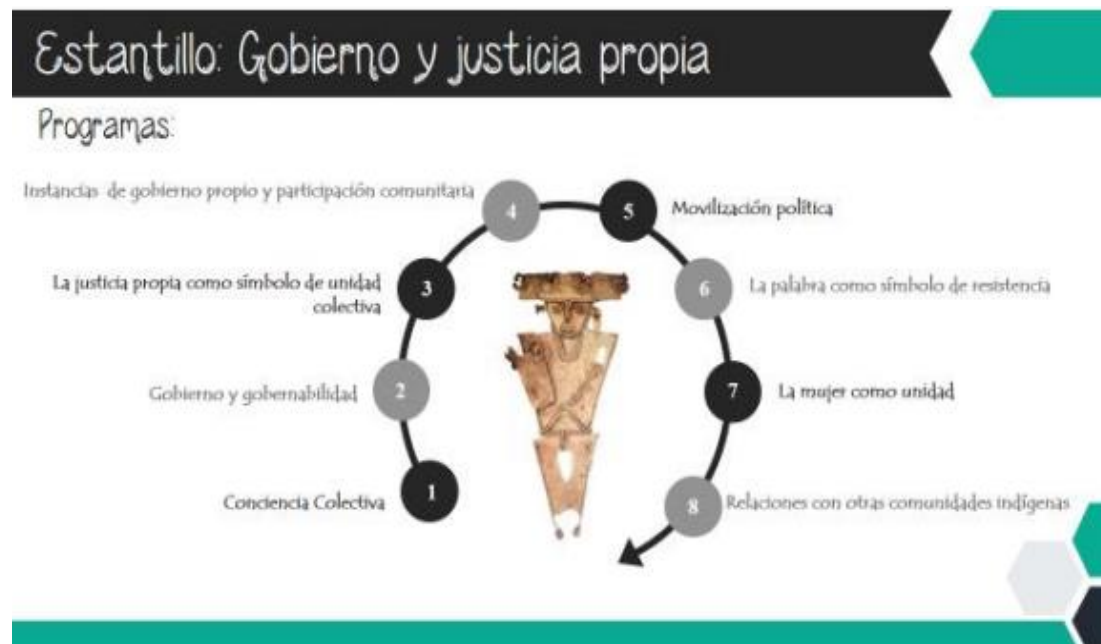
Ilustración 4 Estantillo Gobierno y Justicia Propia Programas, Plan de vida

La comunidad ha realizado avances de ella, que fue expuesta en el proyecto del plan de vida, a continuación expongo una de las imágenes con el desarrollo: